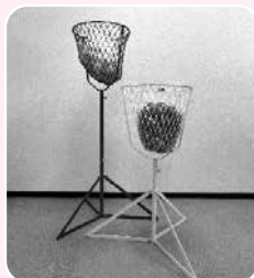
赤白玉入れ ご高齢の方でも、椅子に座りながら楽しんでいたけます

本会では、レクリエーション用品の無料貸し出しを行っています。サロン活動や地域活動でご活用ください。