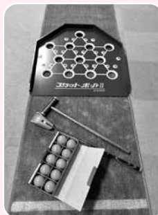
スカットボール グラウンドゴルフのような感覚で楽しめます