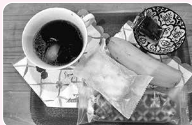
飲み物とお菓子と♪