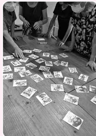
方言カルタで盛り上がりました♪