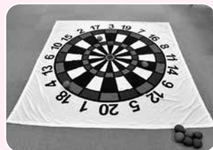
コロコロダーツ 床に的を敷き、コロコロ転がしてダーツを当てます