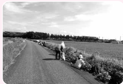
六之井地区 あじさいロード（青空サロン）

はじめに、六之井地区の方より、「つながり続ける取り組み」として、お茶会・あじさいロード・神社清掃の活動をご紹介いただきました。その後、グループに分かれて、サロンについての情報交換を行いました。活動紹介では、お茶会(サロン)に関わる中で感じた難しさや嬉しかったこと、新たにできたつながり、今後の展望等についてお話しいただきました。「何か核になって集まれる場所があるといい」という想いのもと、環境保全活動を通して、集まって「話す」ことを主の目的とした取り組みについてもお話しいただきました。